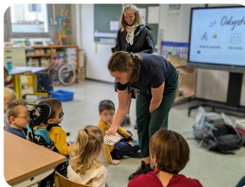
"L'Odystop" en visite à Dijon le 5 septembre.