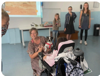
"La TRIBU'S" en visite à Marseille le 19 septembre.