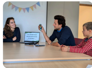
"Let's realize" en visite à Rennes le 27 septembre.

Au gré des 5 continents, des espaces les plus sauvages de Patagonie aux plaines africaines, du Cap Horn aux Cordillères subtropicales, du haut des volcans d'Asie en passant par les déserts et l'océan... nos 17 expéditions solidaires parcourent le monde entier !