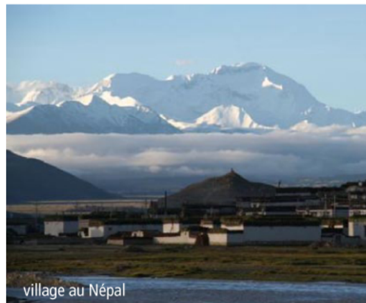
village au Népal